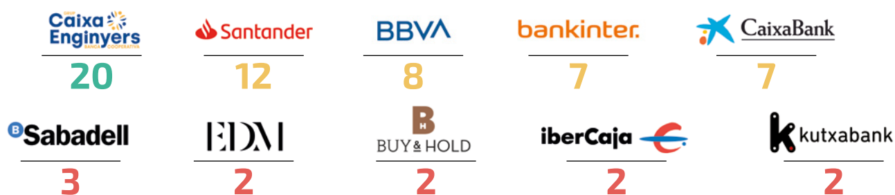
Quadre 1. Puntuacions de les polítiques en matèria d'armament i defensa de les entitats financeres del Top-10 de la banca armada i de la militarització de fronteres espanyola

També hem analitzat un grup d'entitats financeres d'àmbit internacional que operen a la Comunitat Valenciana. D'entre les 6 escollides, totes elles –excepte UBS– són entitats financeres que tenen un negoci molt significatiu a l'Estat espanyol en clau de banca tradicional, no tant d'inversió, amb molts clients i treballadors i múltiples oficines (més en el cas de Deutsche Bank, ja que la resta operen més a través de la banca online i tendeixen a minimitzar-ne el número). Cal destacar com tots ells facturen entre centenars i milers de milions d'euros l'any i tots formen part del que anomenem la banca armada internacional, apareixent 4 dels 6 en el Top-100 de la banca armada internacional de 2023 (quedant fora només ING que ocupa la posició 118 i Banco Mediolanum la 455). Sent coneixedors de les limitacions que l'anàlisi de tan sols 6 entitats pot aportar, entenem que es tracta d'una mostra significativa d'entitats bancàries