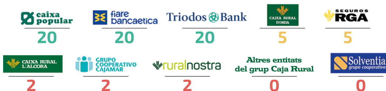
Cuadro 3. Puntuaciones de las políticas en materia de armamento y defensa de entidades de la Banca Social en la Comunitat Valenciana