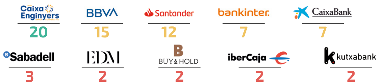
Quadre 1. Puntuacions de les polítiques en matèria d'armament i defensa de les entitats financeres del Top-10 de la banca armada i de la militarització de fronteres espanyola

També hem analitzat un grup d'entitats financeres d'àmbit internacional que operen a la Comunitat Valenciana. D'entre les 6 escollides, totes elles –excepte UBS– són entitats financeres que tenen un negoci molt significatiu a l'Estat espanyol en clau de banca tradicional, no tant d'inversió, amb molts clients i treballadors i múltiples oficines (més en el cas de Deutsche Bank, ja que la resta operen més a través de la banca online i tendeixen a minimitzar-ne el número). Cal destacar com tots ells facturen entre centenars i milers de milions d'euros l'any i tots formen part del que anomenem la banca armada internacional, apareixent 4 dels 6 en el Top-100 de la banca armada internacional de 2023 (quedant fora només ING que ocupa la posició 118 i Banco Mediolanum la 455). Sent coneixedors de les limitacions que l'anàlisi de tan sols 6 entitats pot aportar, entenem que es tracta d'una mostra significativa d'entitats bancàries