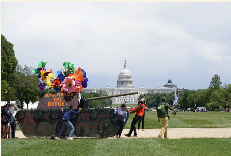
Dies d'Acció Global sobre la Despesa Militar (GDAMS) 2021.